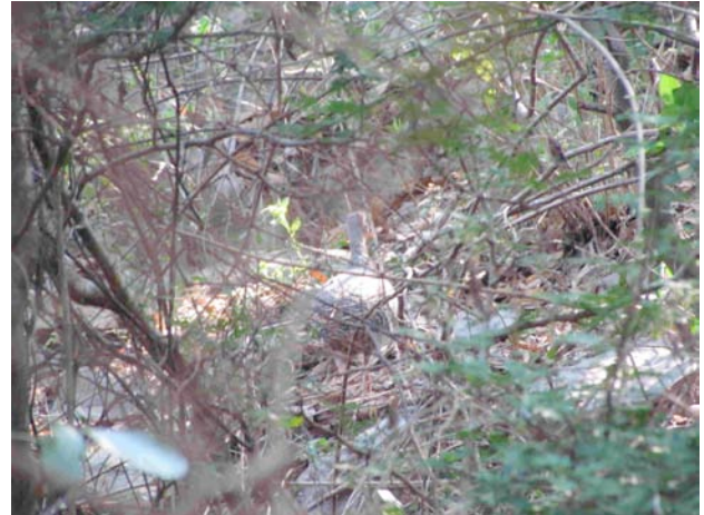
Figura 2. Tinamú canelo ( Crypturellus cinnamomeus ) en la localidad de Charco Azul, Monumento Natural Cerro de la Silla, Nuevo León.

msnm) (Figura 3). Esta cámara fue puesta en el lugar con el objetivo de detectar mamíferos en un estudio paralelo. La vegetación del sitio es matorral submontano de Ebenopsis ebano y Sargentia greggii .