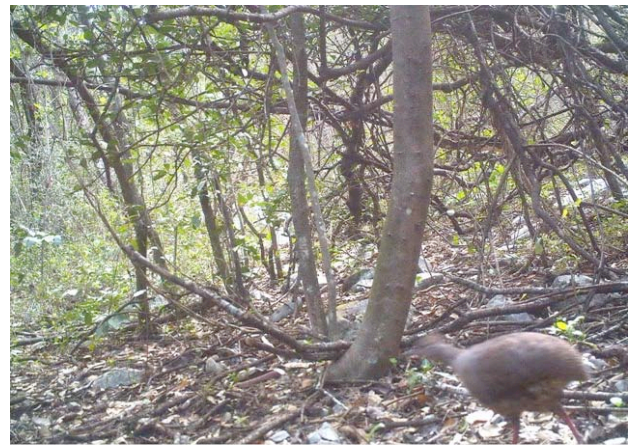
Figura 3. Tinamú canelo ( Crypturellus cinnamomeus ) en la localidad del Yerbaniz del área natural protegida Sierra “Cerro de la Silla”.