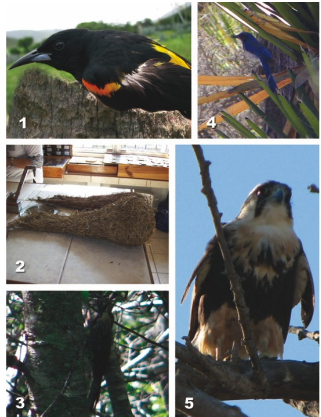
Figura 2. 1) Icterus wagleri (foto: S. Terán-Treviño), 2) nido de Psarocolius montezuma , 3) Lepidocolaptes affinis (foto: E. Rodríguez-Ruíz), 4) Aphelocoma californica (foto: A. Sánchez-González) y 5) Falco femoralis (foto: E. Rodríguez-Ruíz).

disturbio como aptos para su reproducción. Lo anterior probablemente se deba a que utiliza los sitios abiertos en áreas urbanas que les otorgan a los machos posibilidades de vigilancia para detectar depredadores o aves parásitas (Nava 1994), por lo que el impacto antropogénico, más que afectar a sus poblaciones (Ceballos y Márquez 2000), podría estarlas beneficiando como se ha documentado para otras especies en México (Álvarez-Romero et al. 2008). Aunque podría argumentarse que su presencia podría ser consecuencia de un individuo que escapó del cautiverio, principalmente porque se registró en una zona urbana, se ha corroborado que no es considerada como un ave de ornato (INE-SEMARNAT y CONABIO 1997) y no se ha detectado su venta ilegal en el estado; además, su registro geográfico más cercano (en línea recta) se encuentra cruzando el río Panuco a sólo 5.6 km en la congregación Anáhuac (22°11'42"N, 97°49'36"O; 61 m snm) en Veracruz (E. Rodríguez obs. pers.).