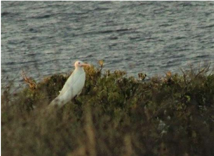
Figura 5. Fragata tijereta ( Fregata magnificens ) con mutación ino, Isla Isabel, Nayarit, México. 25 de noviembre de 2016.

plumajes anormales en poblaciones asentadas en zonas con alta radiactividad o contaminación ambiental, pero en otras situaciones se ha vinculado con un mayor grado de endogamia en las poblaciones, lo que se traduce en una tasa de mutaciones más elevada (Bensch et al. 2000). Lo anterior indica una multiplicidad de causas, genéticas o ambientales, para algunos tipos de aberraciones. En estas seis especies registradas con aberración en el plumaje, la mayoría mostró encanecimiento progresivo, posiblemente la anomalía en el plumaje más frecuente entre las aves, pero no reportada previamente en México.