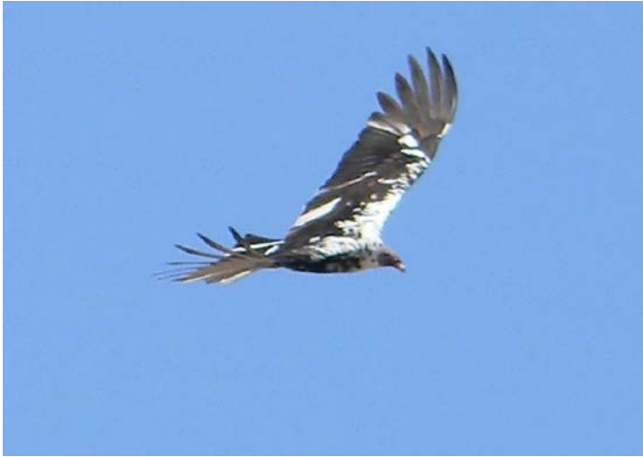
Figura 2. Zopilote aura ( Cathartes aura ) con encanecimiento progresivo, 4 de abril de 2012 en la laguna El Chumbeño, Marismas Nacionales, Nayarit.

que normalmente es marrón y con tenues estrías, era completamente blanco, color que continuaba hacia el abdomen. La coloración de las patas amarillas, ojos y pico negro no se notó afectada (Figura 3). Estas características nos indican que se trata de un individuo con encanecimiento progresivo o con leucismo parcial.