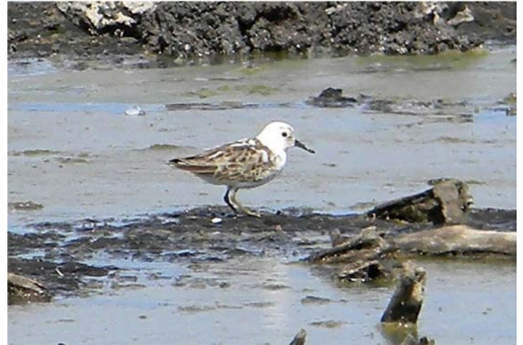
Figura 3. Playero menor ( Calidris minutilla ) con encanecimiento progresivo, Las Cañadas, Marismas Nacionales, Nayarit, fotografiada el 14 de diciembre de 2012.

El individuo estaba emparejado y fue identificado como macho por la longitud de las rectrices y la observación de actos de cópula. La pareja de golondrinas defendió activamente un sitio para anidar, y entre el 7 y el 10 de junio del mismo año ocurrió la puesta de cuatro huevos, sin embargo, éstos no eclosionaron, y mediante la prueba de flotación (Hays y Le-