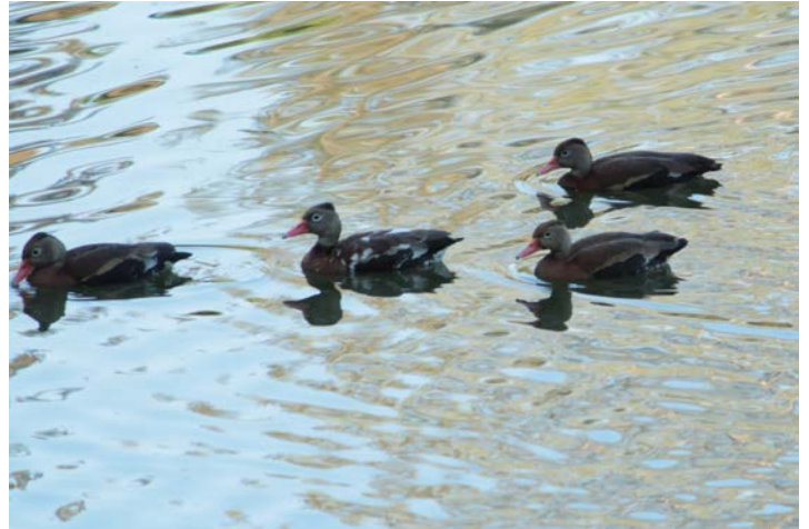
Figura 6. Pijije ala blanca ( Dendrocygna autumnalis ) con encanecimiento progresivo. 6 de febrero de 2018, Parque Ecológico de Tepic, Nayarit, México.