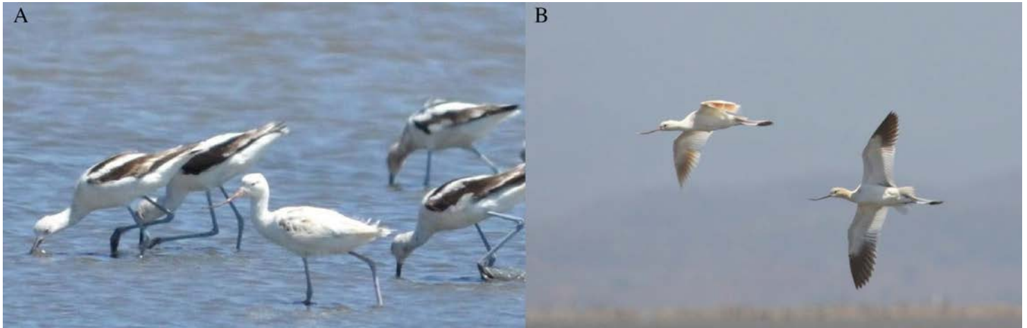
Figuras 1A y 1B. Avoceta americana hembra ( Recurvirostra americana ) con mutación marrón, el 6 de abril de 2012, laguna El Chumbeño, Marismas Nacionales, Nayarit, México.

especies de aves, no descritas para el occidente de México: cuatro casos de encanecimiento progresivo, y posteriormente exponemos dos tipos de mutaciones: marrón e ino. Las observaciones están descritas en orden cronológico, desde la más antigua a la más reciente. Cabe señalar que si bien existe un reporte previo para una de las observaciones (Ayala-Pérez et al. 2013), consideramos pertinente discutirlo.