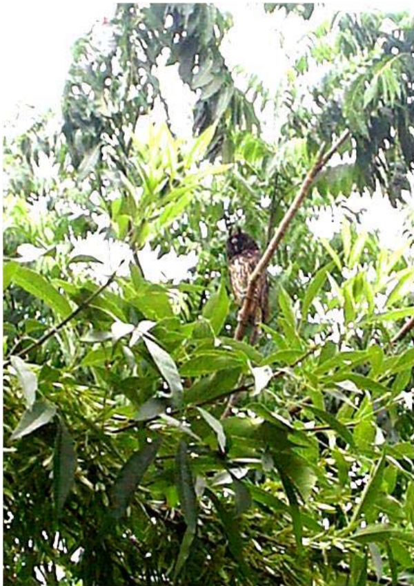
Figura 2. Búho cara oscura ( Asio stygius ) registrado en el área urbana del Instituto Tecnológico de Ciudad Victoria, Tamaulipas, el 25 de junio de 2007.

de cedro rojo ( Cedrela odorata ) en los jardines del Instituto Tecnológico de Ciudad Victoria (ITCV), Tamaulipas (23°45'13"N, 99°10'01"O; 325 msnm). Al individuo se le pudo registrar con una fotografía de baja resolución (Figura 2). La zona del registro es un área urbana con especies arbóreas predominantes como benjamina ( Ficus benjamina ), framboyán ( Delonix regia ), San Pedro ( Tecoma stans ), mezquite ( Prosopis laevigata ), casuarina ( Casuarina equisetifolia ), jacaranda ( Jacaranda mimosifolia ), anacahuita ( Cordia boissieri ), fresno americano ( Fraxinus americana ), entre otras. Cabe señalar que hacia la parte norte del ITCV quedan pequeños remanentes de un matorral subinnerme (Miranda y Hernández 1963). Por lo que nuestro registro proporciona información acerca de otro tipo de vegetación no documentado como utilizado por la especie.